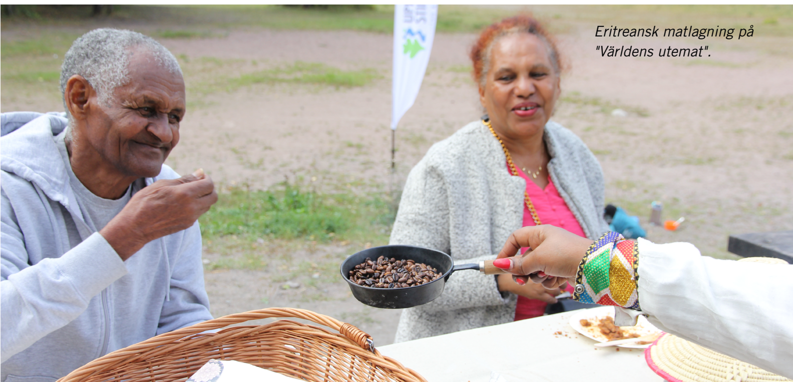
Eritreansk matlagning på "Världens utemat".