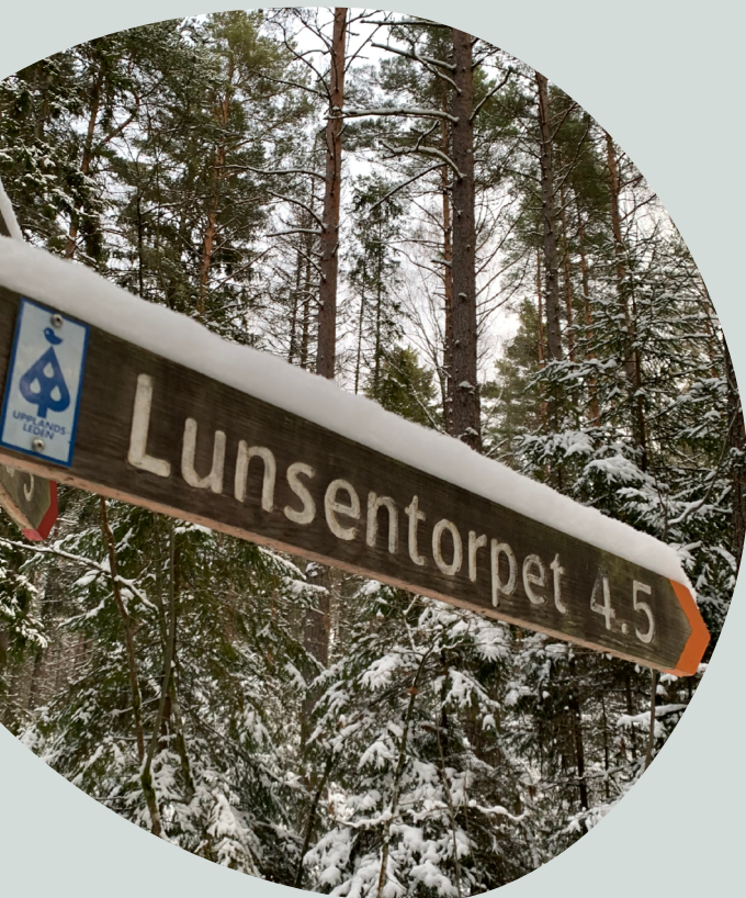
Referensgruppen möttes för vandring till Lunsentorpet.

Nätverksträffarna har vi för det mesta haft digitalt, men en träff utomhus och några fysiska möten.