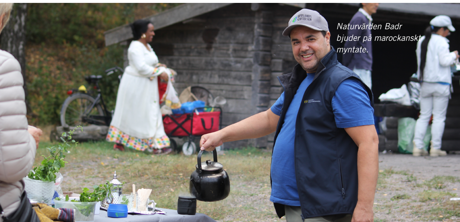
Naturvärden Badr bjuder på marockanskt myntate.