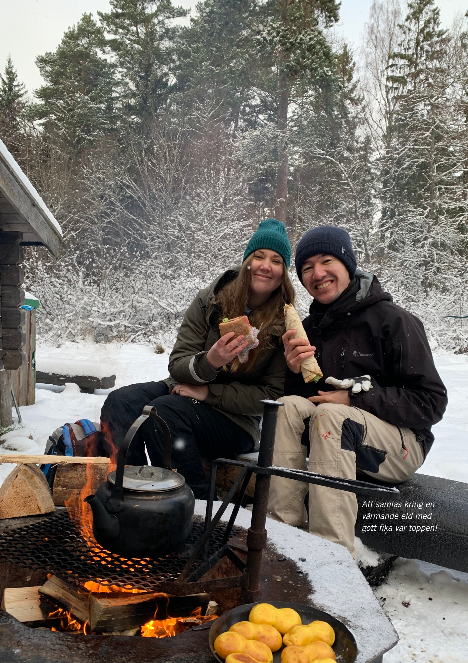
Att samlas kring en värmande eld med gott fika var toppen!