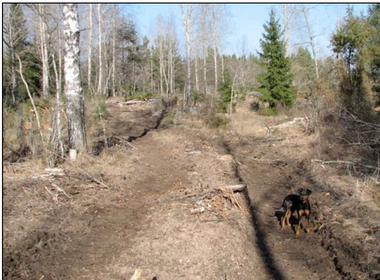
Körskador nära virkesavlägget i Mellantorp.

Även om avverkningen utfördes storskaligt med de största maskinerna gav den inte särskilt stora markskador eftersom vädret var bra och markförhållandena torra. Några mindre missförstånd ledde till att lite mer asp än vad som var tänkt högs. Utskotningen av virket genomfördes också vid bra väderlek medan riset blev liggande längre. När riset skotades ut blev markskadorna på sina håll omfattande och bör åtgärdas med grävmaskin under våren 2008.