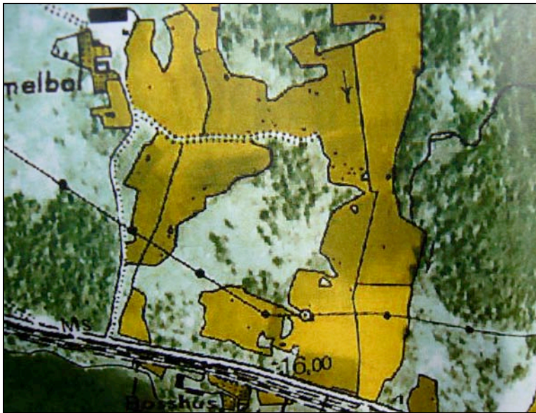
Jordbrukslandskapet vid Bosshus före granplanteringsivern.