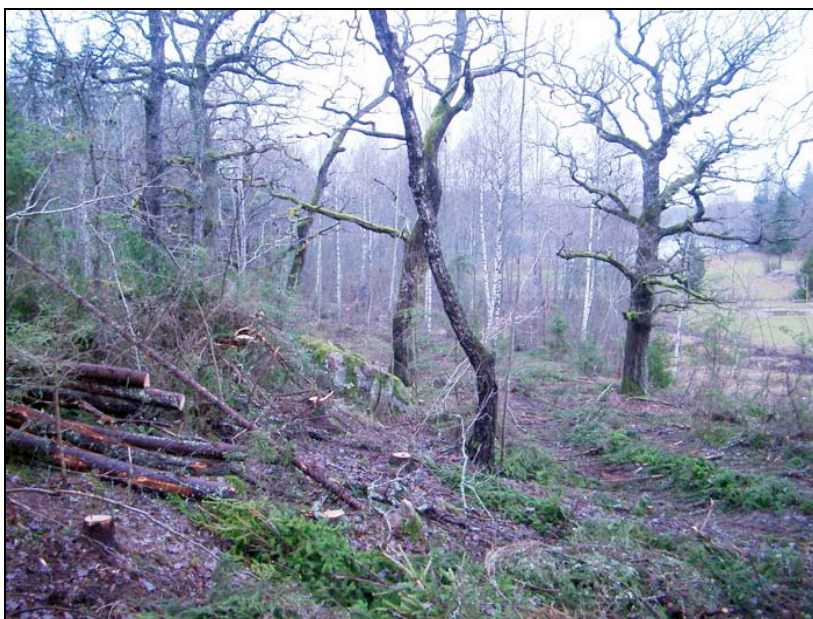
Friställning av ekar under 2003 års restaurering av betesmarken vid Borgardalsbadet.