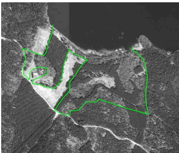
Stängseldragning vid Hjälmsätra.