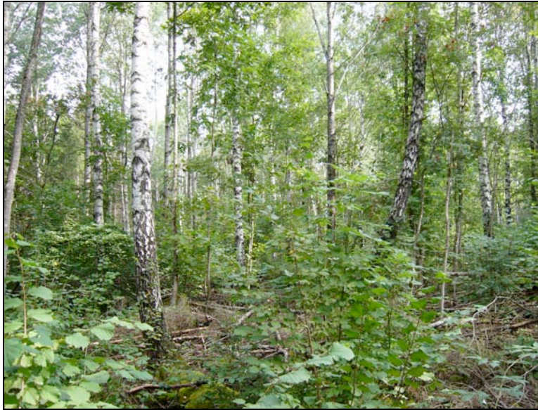
Bosshus, blandlövskog där gran avvecklats. Beståndet nu åter under igenväxning.