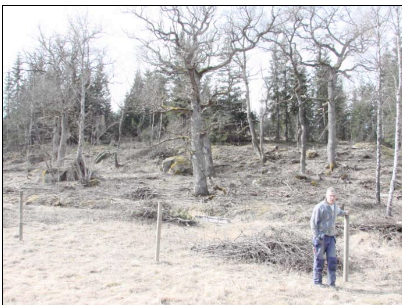
Stängseluppsättning vid Borgardalsbadet 2007.