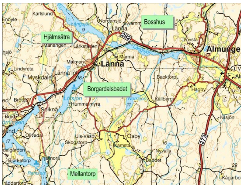
Översiktskarta över Lännaområdet.

Arbetet med Länna eklandskap är en del av projekt Ekologisk landskapsplanering som Upplandsstiftelsen bedrivit i Länna-trakten sen år 1998. De objekt som vi arbetar med, varav några redovisas nedan, har framkommit genom en rad olika naturinventeringar Upplandsstiftelsen genomfört i landskapet. Arbetet har skett i nära samverkan med Holmens skog. Under senare tid har Uppsala kommun samt Länsstyrelsen bidragit till arbetet med medel från Åtgärdsprogram för hotade arter och miljöer. Skogsstyrelsen har genom "gröna jobb" utfört en stor del av det praktiska arbetet på plats.