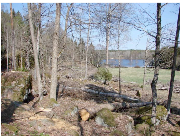
Hjälmsätra, norr gården där restaureringshuggningar fortsatte under 2007.