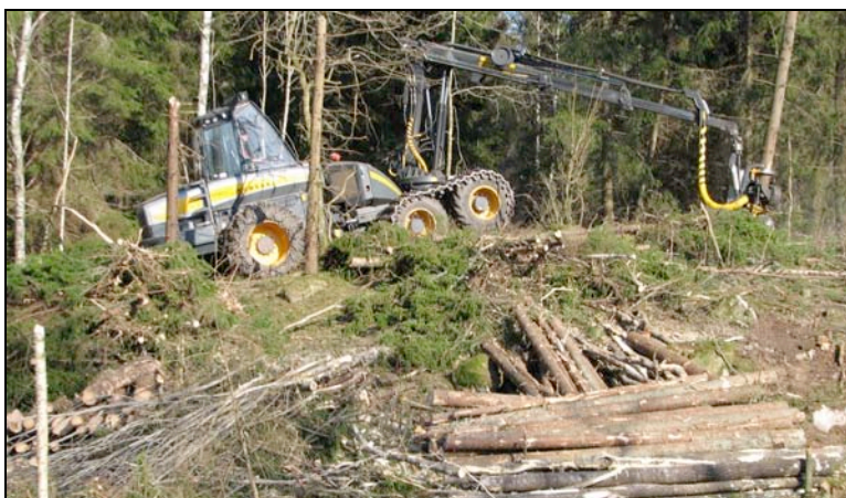
Skördare i arbete på moränryggen (område 5) i betesmarken i Mellantorp.