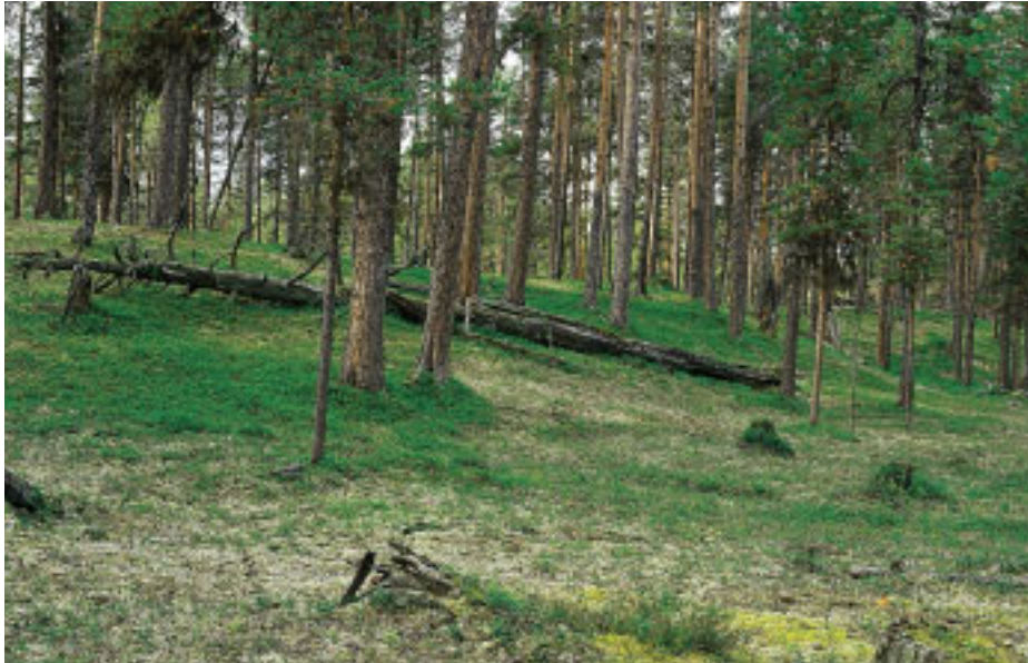
Sandtallskogar är den huvudsakliga växtmiljön för blåfotad och skrovlig taggsvamp ( S. glaucopus och S. scabrosus ). I denna miljö finns även några andra rödlistade mykorrhizasvampar.