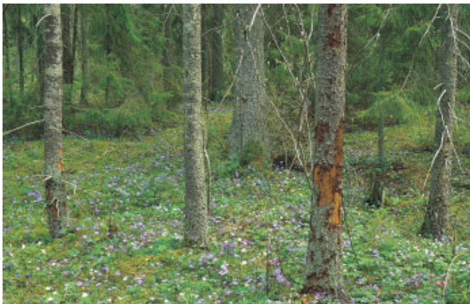
Blåsippgranskog – en viktig miljö för många arter av fjälltaggsvampar och andra rödlistade mykorrhizasvampar.