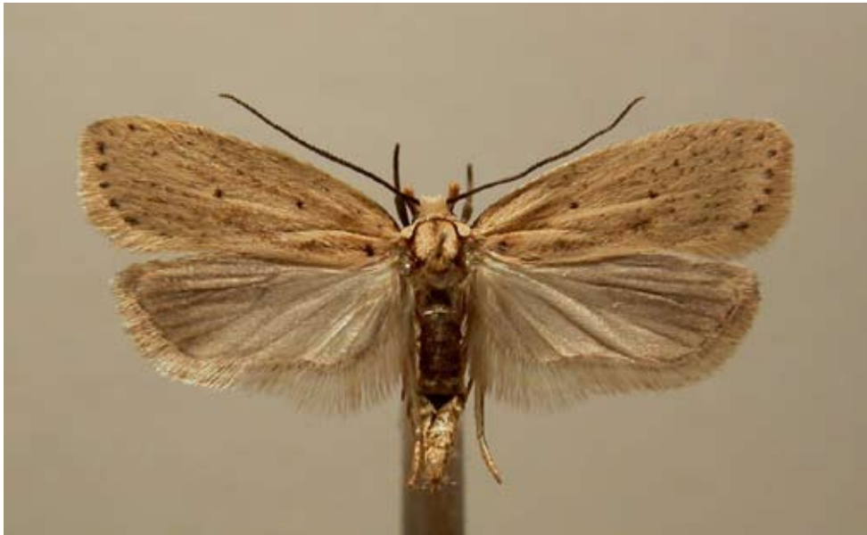
Figur 1 Ängsskäreplattmal

Larven lever i maj-juni i ett bladrör på ängsskära. Den blir som fullvuxen ca 20 mm lång och är till färgen svart eller svartbrun med bruna teckningar på huvudet (figur 2).