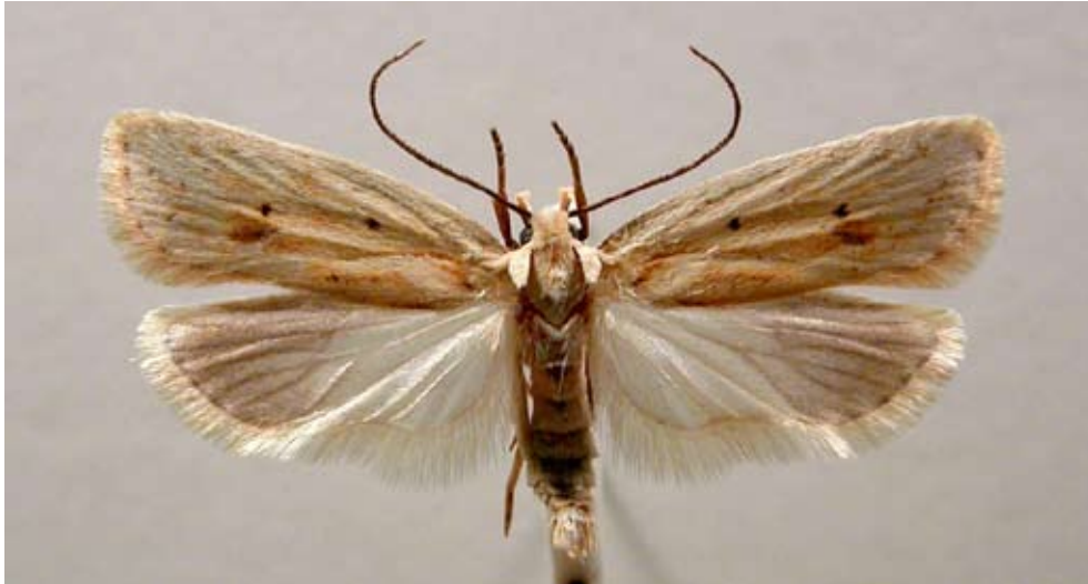
Figur 5 Klintplattmal

Rödclintplattmal A. pallorella är en sällsynt och lokal art som i Sverige förekommer utmed kusterna i den södra delen av landet. Arten påträffas i regel på torra soliga habitat, men åtminstone på Öland förekommer arten ibland tillsammans med ängsskäreplattmalen. Grundfärgen på framvingen är benvit med en svart mittfläck. En inre, mindre fläck finns ibland. I den yttre delen av framvingen är vingribborna svartpuddrade. Nära bakkanten syns en mörk avlång fläck som aldrig, till skillnad från de två andra arterna, utvidgas till en rund fläck. Vingspann 19-24 mm. Rödclintplattmalen övervintrar som fullbildad och har därmed en annan fenologi med senare larvutveckling och kläckningstid än ängsskäreplattmalen. Möjligen kan långlivade individer överlappa varandra något i flygtid hos de tre arterna, men detta bör höras till undantagen (figur 6).