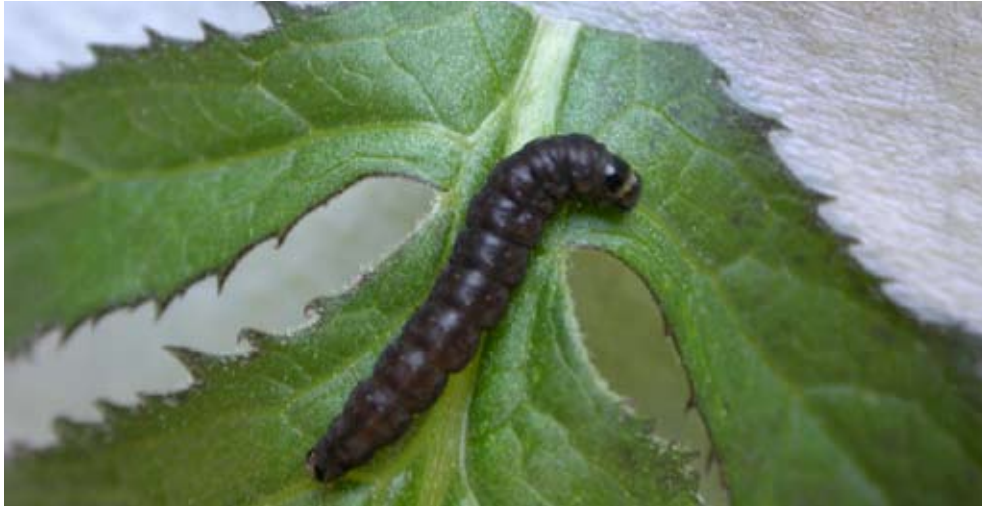
Figur 2 Larv av ängsskäreplattmal, slank och pigg.