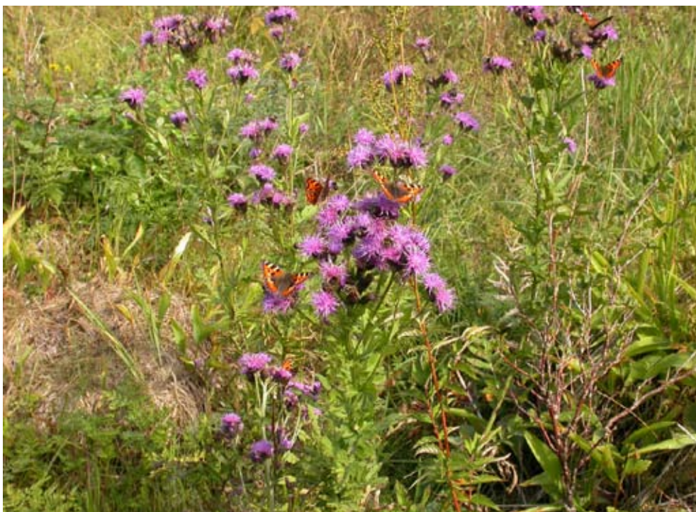
Figur 3 Ängsskära i Lingnåre kulturresevat, norra Uppsala län en solig dag i juli

Ängsskära är en flerårig, kal ört i familjen Asteraceae som kan bli nästan en meter hög. Stjälken är upprätt, fårad och i regel grenig upptill. Bladen sitter strödda och är sågtandade och saknar tornar. De nedre bladen är hela medan de övre vanligen är parflikiga. Blomkorgarna är avlånga och sitter samlade i klase- eller kvastlika ställningar. Holkfjällen är tegellagda och mörkt brunvioletta. Blommorna är likstora, rörliga och vanligen rödvioletta (sällan vita). Frukten har en pensel som består av både enkla och fjäderlika hår. Ängsskärans blommor från juli till september och kan knappast förväxlas med andra arter. Växten påminner mest om en tistel, men skiljs lätt genom avsaknaden av tornar (figur 3).