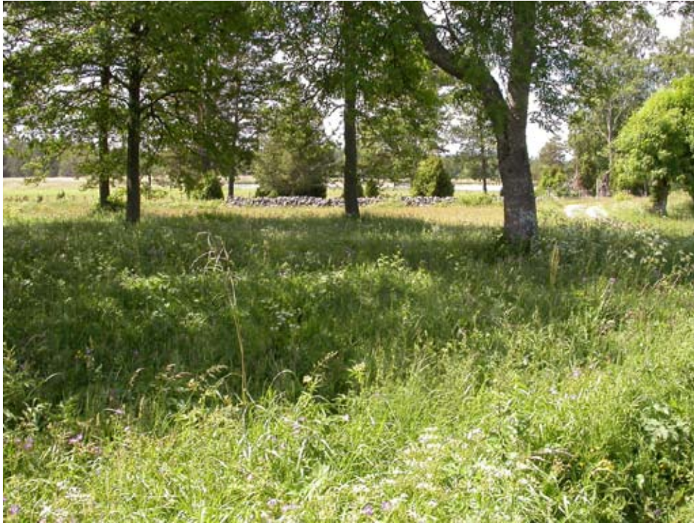
Figur 8 Bondskärets naturreservat i Uppsala län. Ängsskäreplattmalen finns i en fålla med sent betespåsläpp