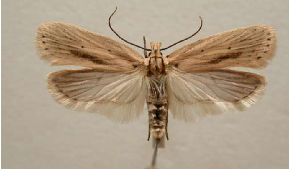
Figur 6 Rödclintplattmal

Kardborreplattmal , A. arenella är en vanlig art som är utbredd i alla län upp till Västernorrlands län. Larven lever i bladrör på ett flertal korgblommiga växter, däribland ängsskära.