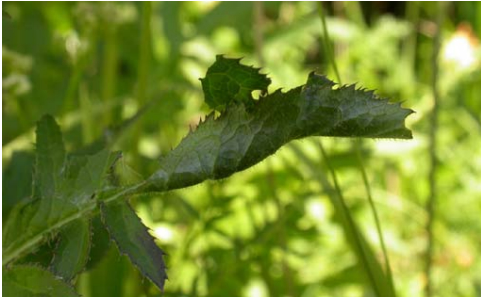
Figur 4 Bladrulle gjord av ängsskäreplattmalens larv

Larven lever i ett bladrör av ängsskära under maj- juni. Bladet viks längs med mittnerven och spinns ihop likt en ärtskida (figur 4). Larven äter av toppen på bladet och sannolikt byter larven blad någon gång under tillväxtperioden. Flera larver kan förekomma på samma värdväxt. De finns spridda över hela växten. Några ägg eller andra spår av ängsskäreplattmalen har inte kunnat påträffas.