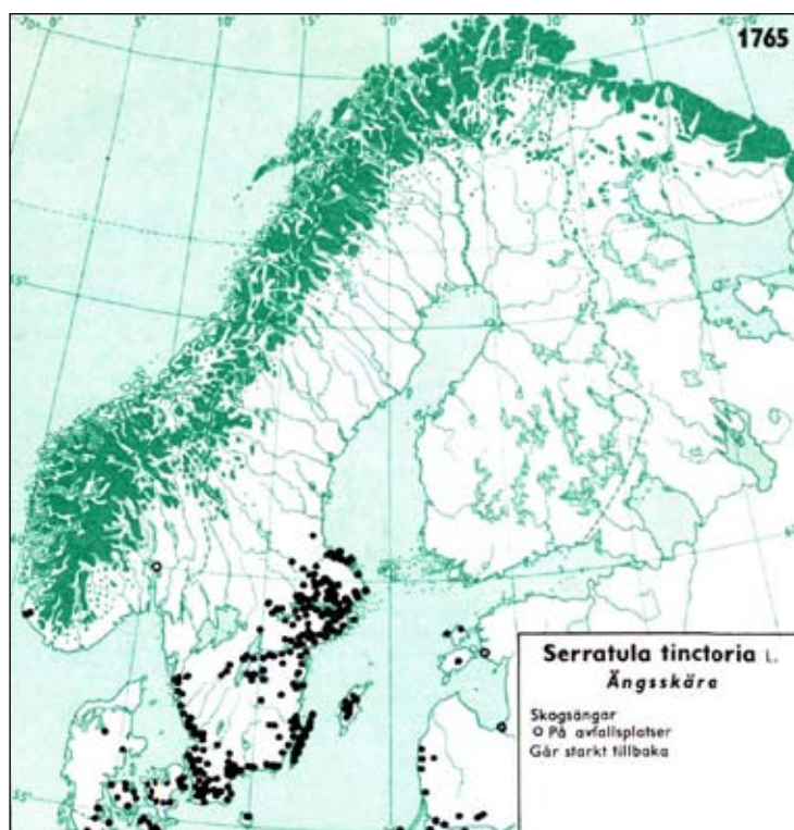
Figur 10 Utbredning av ängsskära i Norden. Hultén. 1971. Naturhistoriska riksmuseet, Virtuella floran.

Vid jämförelser av äldre och nya kartor över ängsskärans utbredning ser man ingen uppenbar minskning av arten i Uppland. Vid fältbesök ser man dock tydligt att ängsskäran ofta lever kvar i små tynande bestånd i ohävdade, igenväxande marker eller i randzonen av hårt betade hagmarksområden. I regel är växten på rask tillbakagång och ängsskäreplattmalen är i de flesta fall redan borta. Hultén skriver redan 1971 att ”växten går starkt tillbaka” (figur 10).