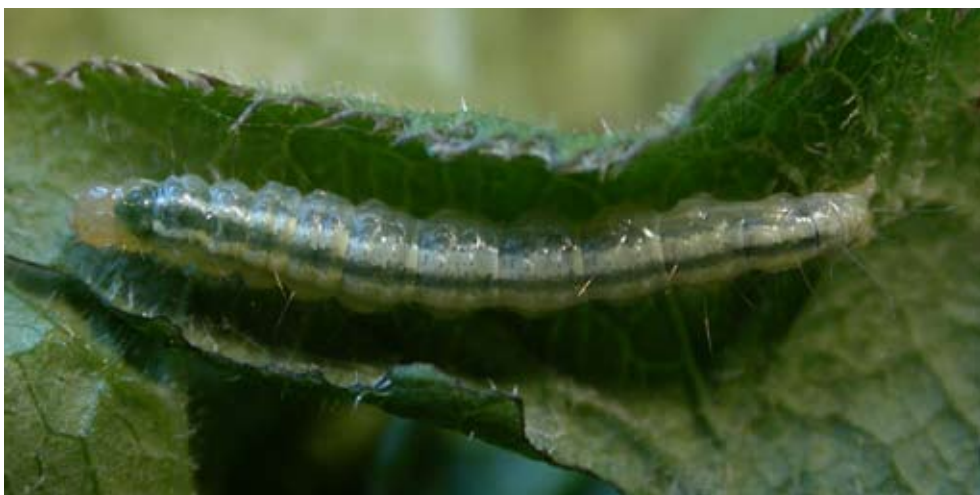
Figur 7 Kardborreplattmalens larv

Till skillnad från ängsskäreplattmalen övervintrar kardborreplattmalen som fullbildad, men larverna utvecklas ändå delvis under samma årstid och bladrören kan då lätt blandas samman. Däremot är de två arternas larver lätta att åtskilja. Som ung är kardborreplattmalens larv ljus grön eller ljus gulbrun med en svagt mörkare rygglinje. Huvudet är brunt med en svart fläck på sidan i den främre delen och en baktill. Nackskölden är grön med en svart fläck i varje bakhörn. Som äldre är larven ljus vitgrön eller blekt gulgrön med tre gröna eller gråbruna längsgående linjer. Huvudet är ljus brunt med fyra svarta fläckar på nedre kanten. Nackskölden på äldre larver är ljusbrun med en stor svart fläck på var sida (figur 7).