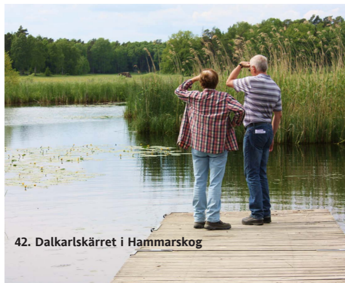
42. Dalkarlskärret i Hammarskog

Liten badvik i skogen. Upplandsleden passerar.