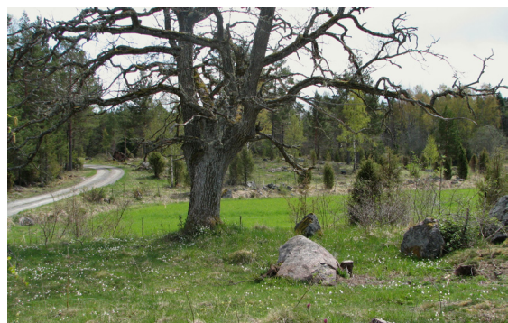
Fjärilen trivs i ett småskaligt jordbrukslandskap.

Mnemosynefjärilen är hårt bunden till sina levnadsplatser och inventeringar har visat att arten mycket sällan lämnar sitt område. Fjärilen är illasmakande och får därför vara ifred för fåglar.