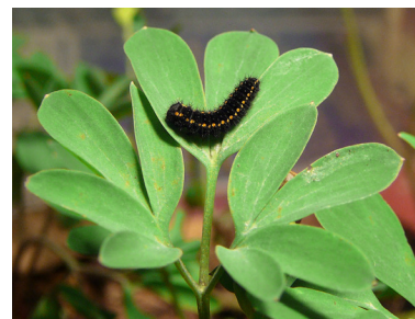
Nunneört - larvens föda.

Mnemosynefjärilen är bunden till omväxlande miljöer bestående av lövskog, buskmark och äng. Fjärilen är beroende av lämpliga nektarrika blommor, främst tjärblomster och fjärilens larv lever uteslutande på nunneört.