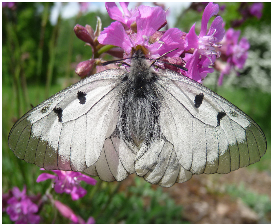
Mnemosyne var minnets gudinna och en av titanerna enligt den grekiska mytologin. Hon var hustru till Zeus och moder till muserna.

Mnemosynefjärilen är en av våra mest hotade fjärilsarter. Fjärilen är mycket sällsynt i Sverige och finns i Medelpad, Uppland och på ett fåtal platser i Blekinge. Länsstyrelsen och Upplandsstiftelsen arbetar sedan 2004 aktivt med åtgärder för att gynna arten, vilket har resulterat i en positiv trend för fjärilen i Uppsala län.