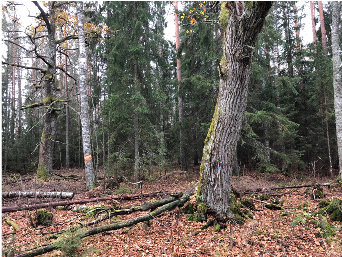
Ringbarkning av björk samt gransanering som pågår i svämskog på Rämsön 2018.