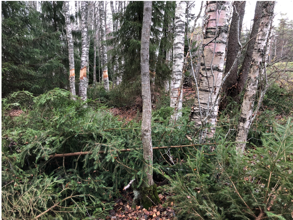
Ringbarkad björk samt gransanering utförd på Rämsön.

I samband med ringbarkningen genomfördes en röjning av gran som etablerat sig på senare år i lövsvämnskogen på Rämsön (objekt 7).