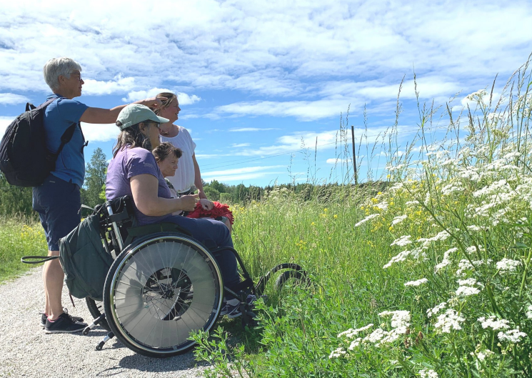
På tur längs Fjärilsstigen