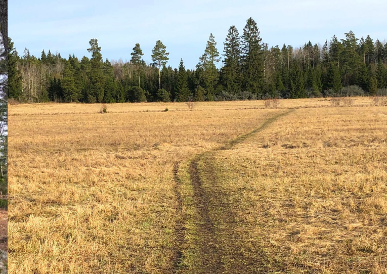
Stigen över ängen