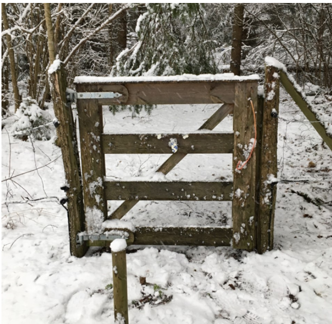
Fallgrind längs vägen