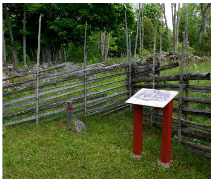
Informationsskylt längs Vikingastigen

Vikingastigen ligger mitt emot parkeringen, på andra sidan bilvägen. En röd skylt pekar in till hagen där stigen börjar. En smal och kort spång (0.6 m bred) går över ett dike och leder dig genom en lätt fallgrind in till hagen. I hagen finns får.