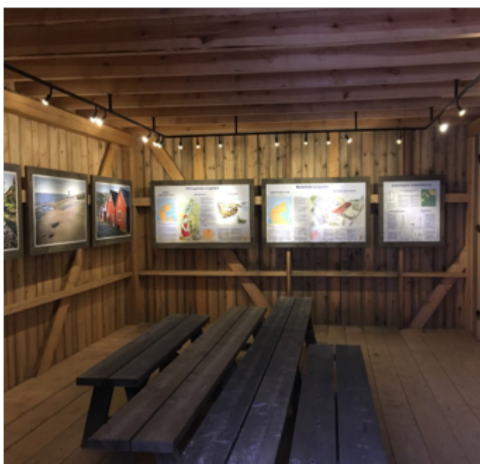
Insidan av ladan