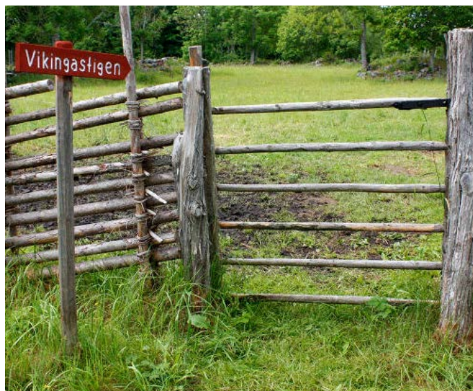
Grinden in till Vikingastigen