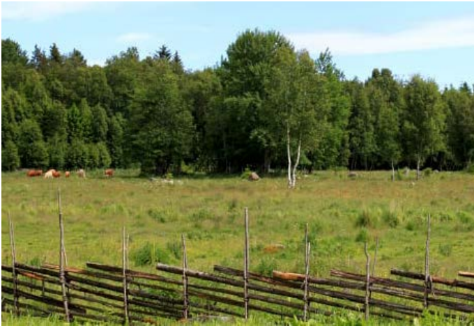
Kohage där medeltidsstigen börjar

Stigen ligger precis intill parkeringen och är tydligt skyltad.