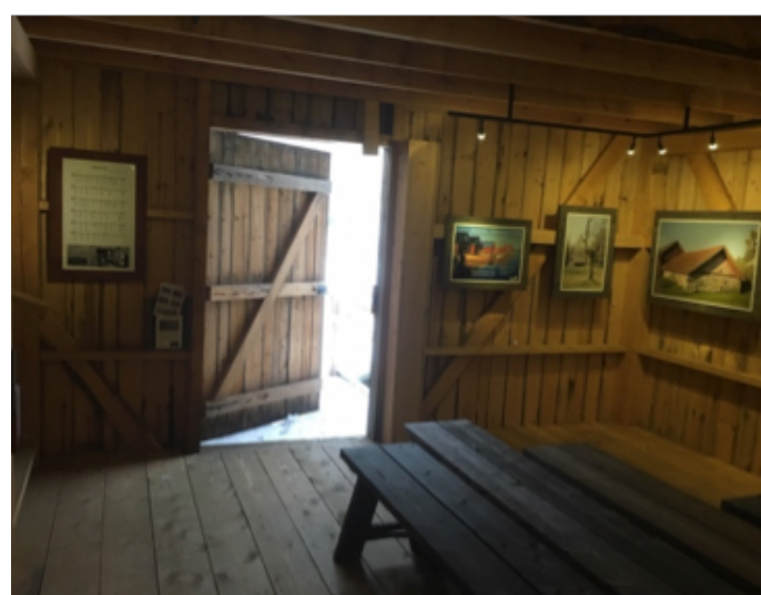
Utgången från ladan