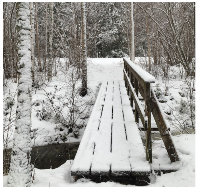
Spång till bilvägen