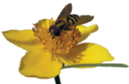
Blomfluga i en smörblomma.

UPPLANDSSTIFTELSENS bildades 1972 för att "underlätta och stimulera allmänhetens friluftsliv" samt "verka för bevarande och skydd av den uppländska naturen". Medlemmar är Landstinget och kommunerna i Uppsala län. Kansliet ligger i Uppsala vid Kungsgärdet Center. Besöksadress är S:t Johannesgatan 28 G. På vår hemsida www.upplandsstiftelsen.se får du mer utförlig information under huvudrubrikerna Vår verksamhet, Utflyktstips, Naturvård, Friluftsliv, För skolan, Upplandsleden och Smultronställen. Kontakta oss gärna. Telefon 018-611 62 71.