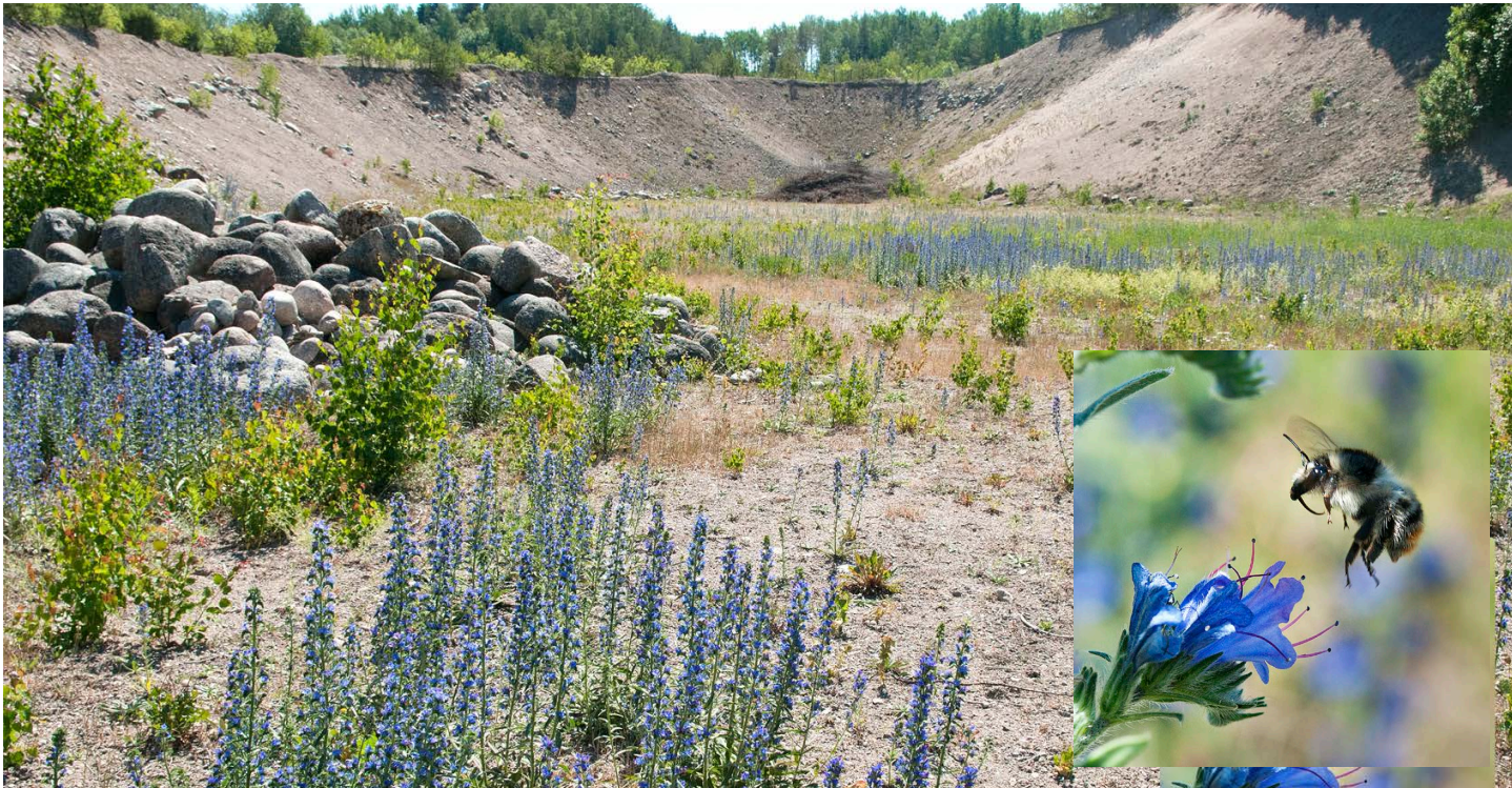
Torslundagropens naturreservat är ett gammalt grustag som Upplandsstiftelsen äger och förvaltar. Här finns blomrika, värdefulla sandmiljöer för insekter. Bland annat blommande blåeld som uppskattas mycket av bin, humlor och fjärilar.