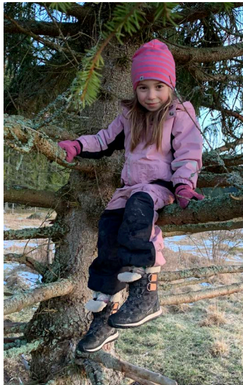
Rörelseglädje i naturen; där finns ständigt nya utmaningar för både barn och vuxna.

Vi som jobbar på naturskolor runt om i Sverige har skrivit en bokserie, Att lära in ute , som ger exempel på hur och vad man kan göra för att använda sig av utomhuspedagogik i sin undervisning. Här kan ni läsa mer om hur man kan använda dessa böcker för att arbeta ute med de globala målen https://www.outdoorteaching.com/sv/vara-bocker/serien-att-lara-in-ute/