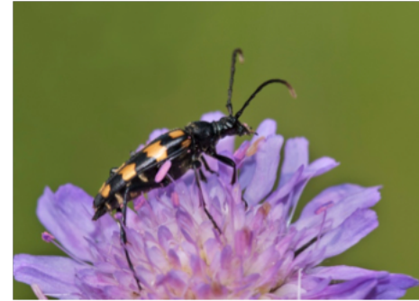
Det är inte bara bin och humlor som pollinerar, utan även andra insekter. Till exempel skalbaggar, som den här fyrbandade blombocken.

Upplandsstiftelsen arbetar med att bevara och förstärka miljöer som är viktiga för pollinering, t.ex. blomrika miljöer, sandiga marker, steniga kulturmarker, småvatten, odränerade och fuktiga marker, gamla träd och död ved.