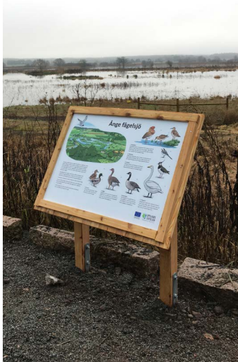
Informationstavlor om natur och fåglar.