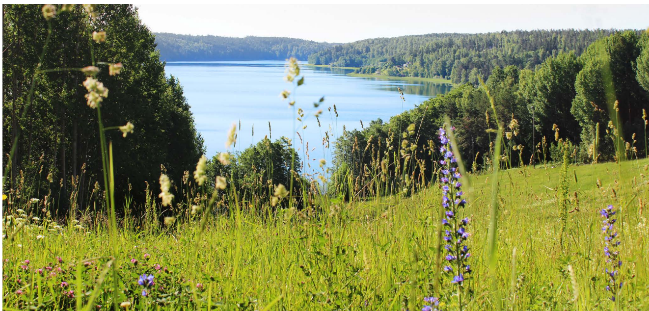
Granåsen äng i slalombacken Ullfjärden.

I reservatet har Upplandsstiftelsen och Håbo kommun på senare år gjort åtgärder för öka tillgängligheten. Från reservatets huvudparkering är det en lättgången men ganska brant stig fram till rastplatsen vid Kvarnkojan. För att underlätta för personer med rörelsesnedsättning har vi istället gjort i ordning en 300 m lång tillgänglighetsanpassad stig från parkeringen vid slalombacken. Längs stigen finns möjlighet att rasta eller vila vid ett fikabord eller en soffa. Skyltar längs stigen berättar om naturen i området.