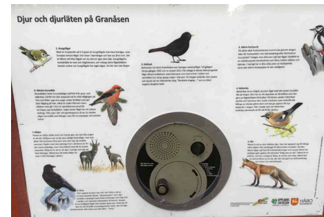
Vevlåda där man kan lyssna på olika fåglar och djur. Veva på hjulet i mitten så hörs ljuden.