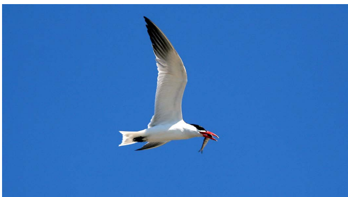
Skräntärna är en hotad fågel som gynnas av fiskrika våtmarker.