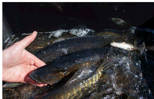
"När gäddorna leker i vik och vass, och solen går ner bakom Sjöbloms dass, jag då är det VÅR!!!"