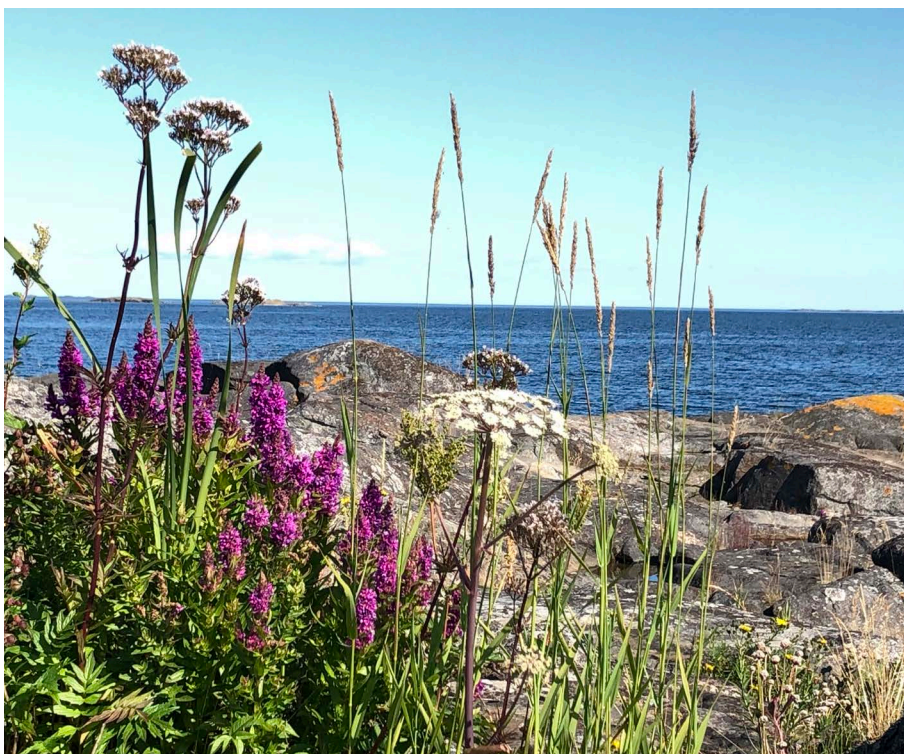
Fackelblomster är vanlig i skärgården.

Inom Leaderprojektet Fiskevänliga och tillgängliga Rävsten arbetar vi med att skapa förutsättningar för alla att kunna komma ned till vattnet och fiska eller håva. Detta görs genom nya flytbryggor där man ska kunna sitta i rullstol och fiska eller bara uppleva vatten. Intill bryggan bygger vi en fiskrensod där man ska kunna rensa fisk både sittande i rullstol och stående. Vi kommer även att köpa in en båt med ramp som ska underlätta transporterna mellan Äpskår och Rävsten.