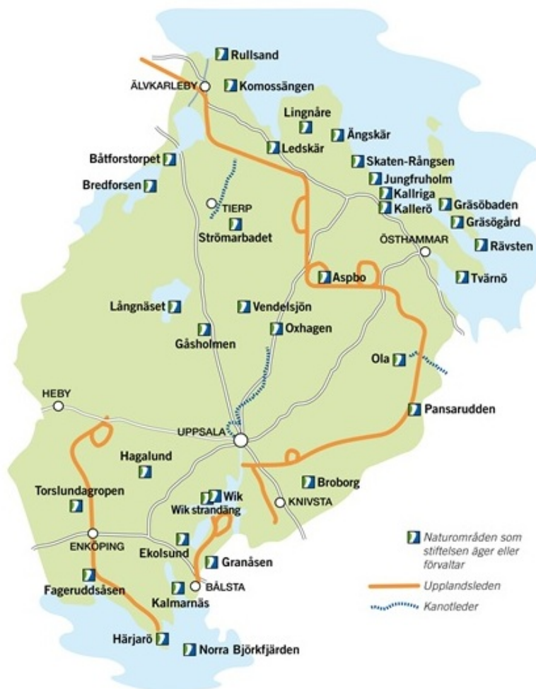
Figur 1. Karta över Upplandsstiftelsens naturområden. ( http://www.upplandsstiftelsen.se/Vara-omraden/oversiktskarta__432 )

Friluftsliv har också en bevisad effekt på folkhälsan. Det finns ett positivt samband mellan lägre upplevd stress och skogsbesök. Fysisk aktivitet och närhet till miljöer som beskrivs som fridfulla och spatiösa har visat sig ge en minskad risk för psykisk ohälsa, främst hos kvinnor (Annerstedt 2011).