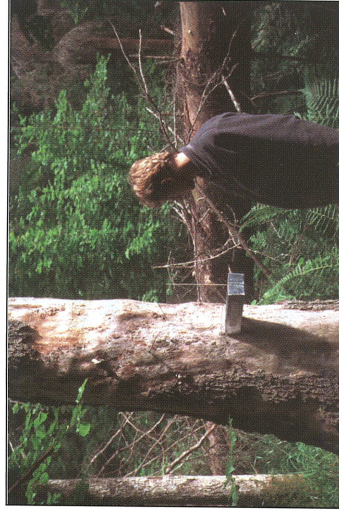
Fig. 3. Granlokalen som låg utanför reservatet, Granön.

Båtforsreservatet och har en yta på 3,4 ha (Fig. 2). Ön omges endast av smala tyllar och omkringliggande öar har liknande naturskogsstruktur. Utanför reservatet togs proverna på Granön som ligger i norra delen av Storfjärden och omfattar 10,3 ha (Fig. 3). Ön ligger 600 m från fastland och omges av stora vattenytor och kärrmarker samt ett antal små skogsklädda holmar. På Granön finns den enda grandomierade naturskogen inom hela undersökningsområdet utanför naturreservaten Bredforsen och Båtfors (Aronsson och Eriksson opubl.). De två bestånden har liknande skogstillstånd, bl.a. är trädens medelålder över 100 år (Tab. 1). Båda hade stor förekomst av lågor och högstubbbar i olika nedbrytningsstadier och klubbicka var frekvent på båda lokalerna. Frekvensen av riktigt gamla (=