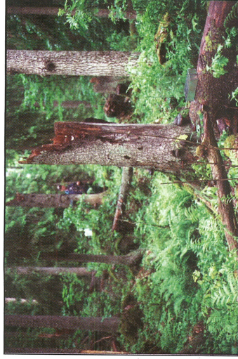
Fig. 2. Granlokalen som låg inne i reservatet, Kolmilöholmen.

The spruce-site within the reserve, Kolmilöholmen.