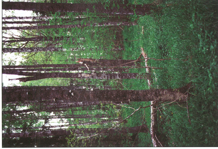
Fig. 6. Den skuggiga björkhögstubbelokalen, Nöttbo.

The open birch high stump site outside the reserve, Brändäng.