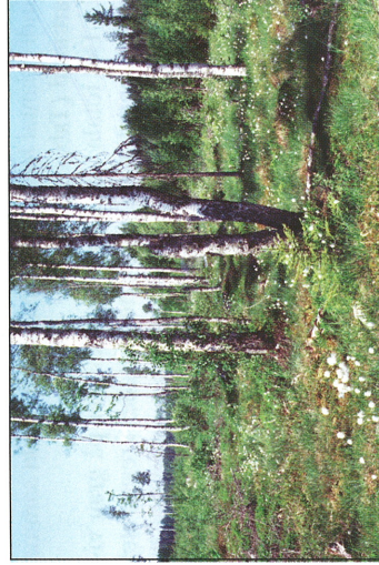
Fig. 5. Den öppna björkhögstubbelokalen utanför reservatet, hygget vid Brändäng.

The birch high stump site laying within the reserve, Björkön.