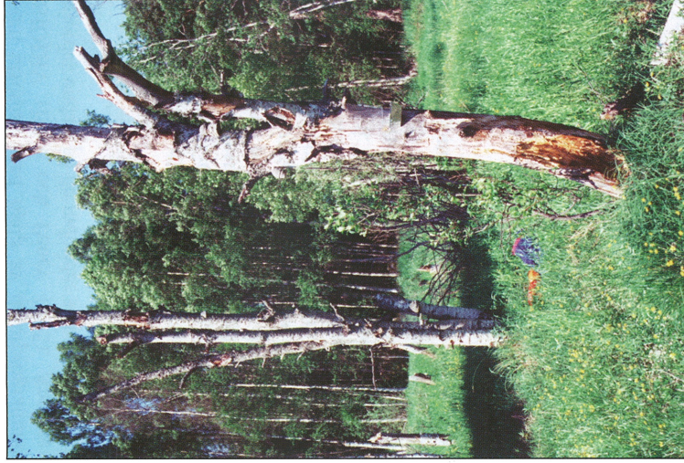
Fig. 4. Björkhögstubbelokalen som låg inne i reservatet, Björkön.

The birch high stump site laying within the reserve, Björkön.