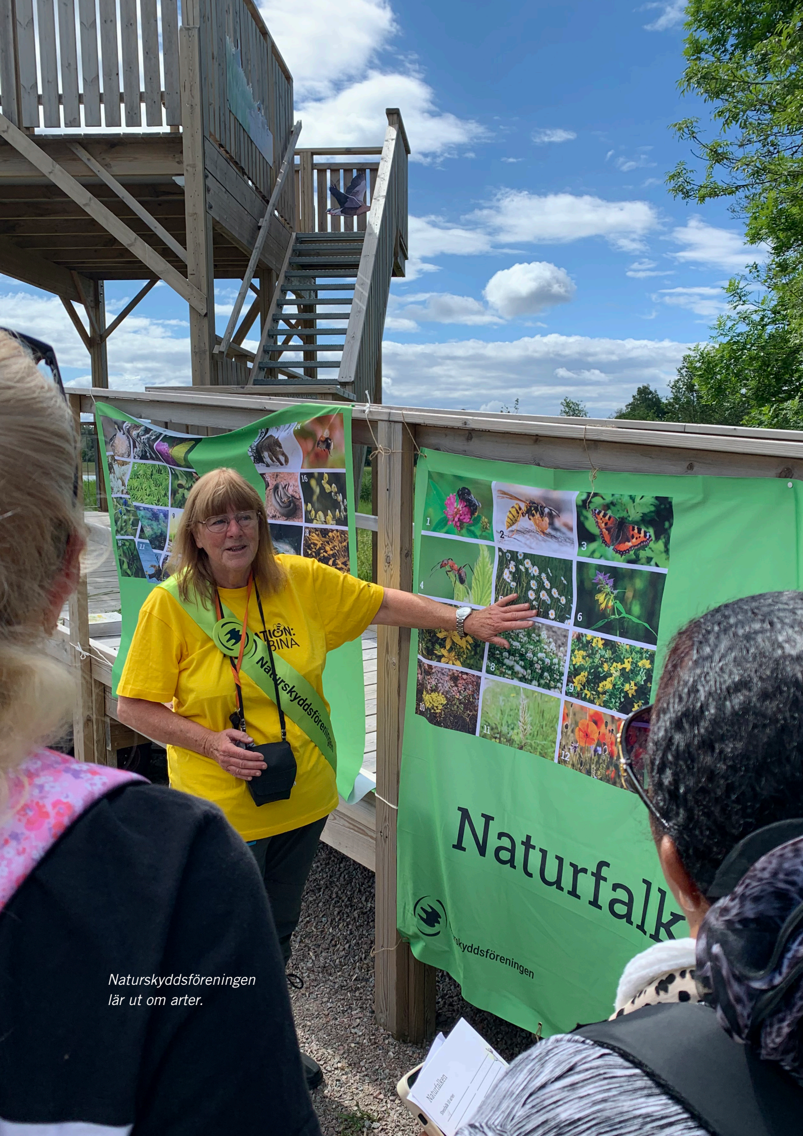
Naturskyddsföreningen lär ut om arter.