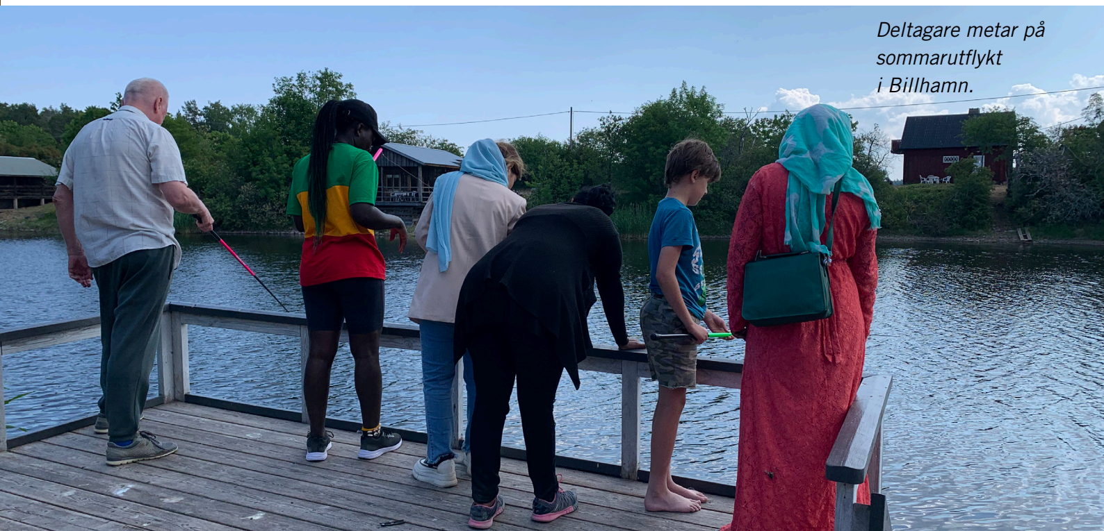
Deltagare metar på sommarutflykt i Billhamn.