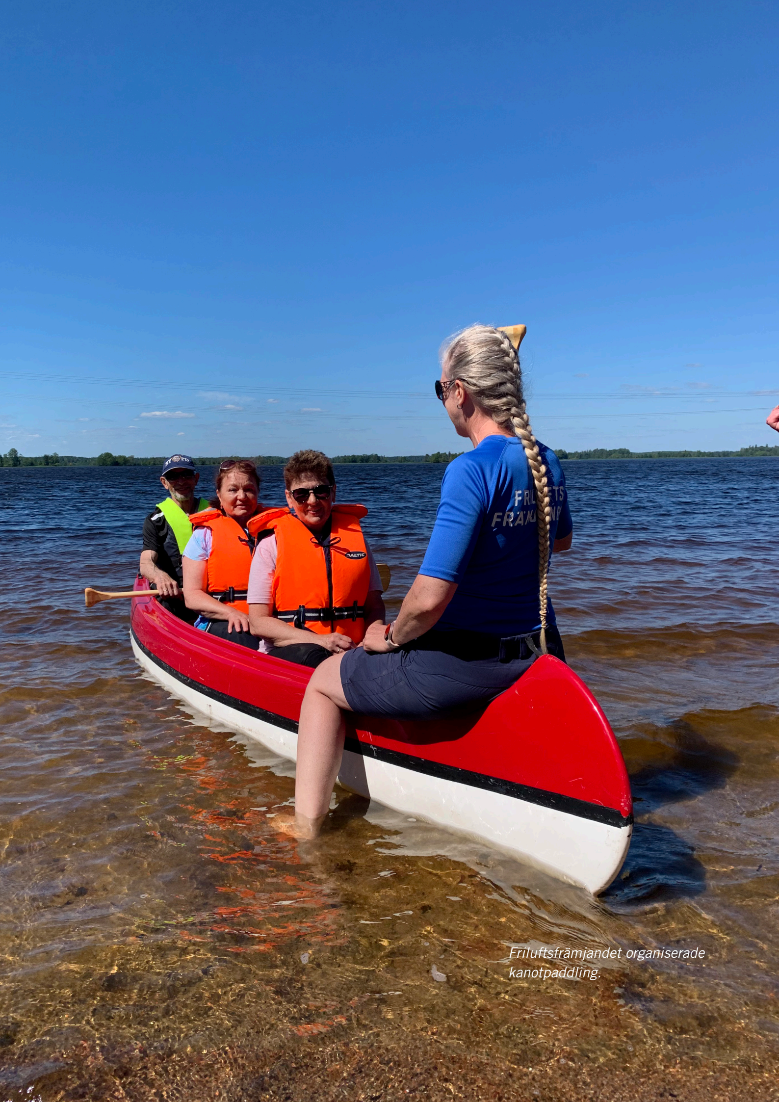
Friluftsförbundet organiserade kanotpaddling.