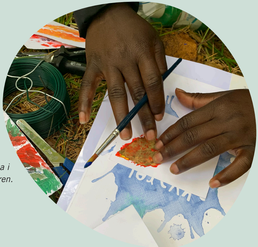
Trädtema i närnaturen.

För att ge SFI möjlighet att själva gå ut och göra enkelt fika, så köptes en murikka och en kaffepanna in till både SFI i Tierp och SFI i Skutskär.